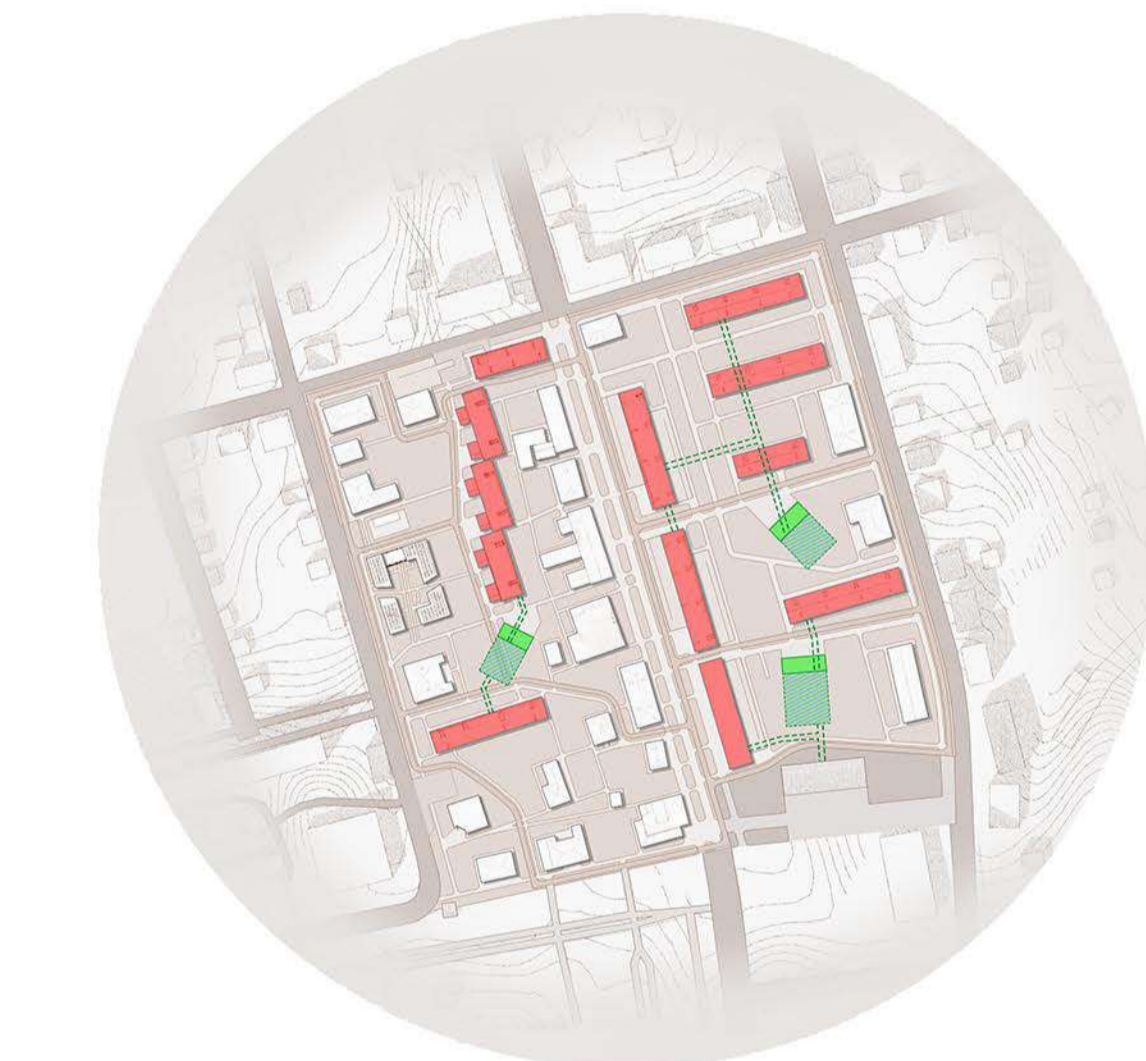
Схема укриттів та бомбосховищ пропонується